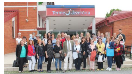
Zajednička fotografija sudionika Petog državnog stručnog skupa održanog u svibnju mjesecu 2019. godine.

Iza nas je pet održanih DSS-a. Hvale vrijedan jubilej je dostojno obilježen. S ponosom se prisjećamo svih koji su aktivno sudjelovali na Petom državnom stručnom skupu prošle godine.