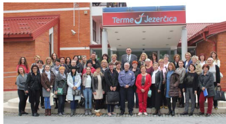
Zajednička fotografija sudionika 2. Državnog stručnog skupa održanog u Hotelu Terme Jezerčica, listopada 2016.